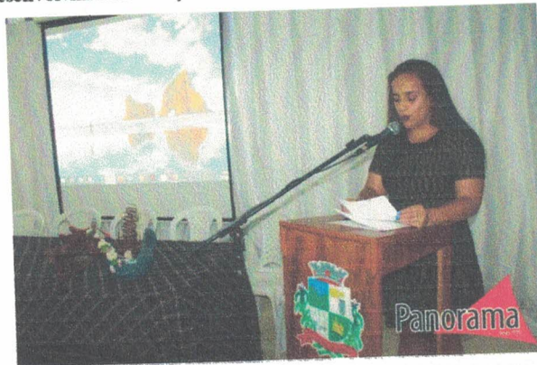
Solenidades de abertura do I Seminário de Patrimônio Cultural, Educação e Turismo de Bocaina de Minas. 27 de outubro de 2022.

Relatório fotográfico, com no mínimo quatro fotos coloridas com informação de data, autoria e legenda. As fotografias apresentadas deverão contemplar cada etapa do desenvolvimento da ação informada.