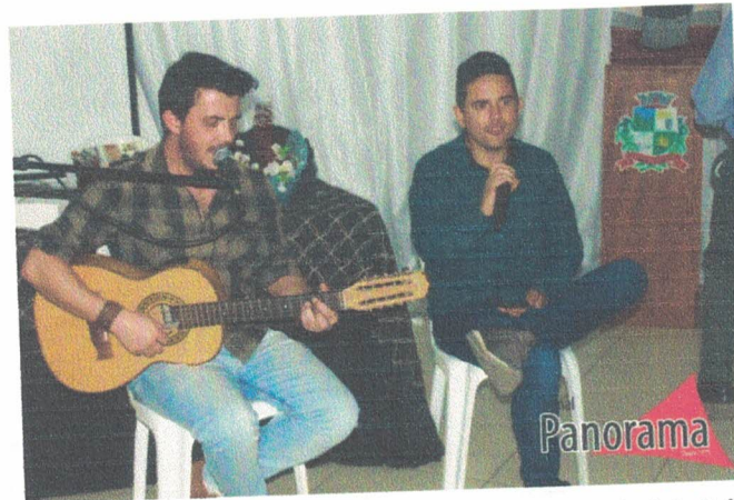
Apresentação cultural de Violas durante o I Seminário de Patrimônio Cultural, Educação e Turismo de Bocaina de Minas. 27 de outubro de 2022.