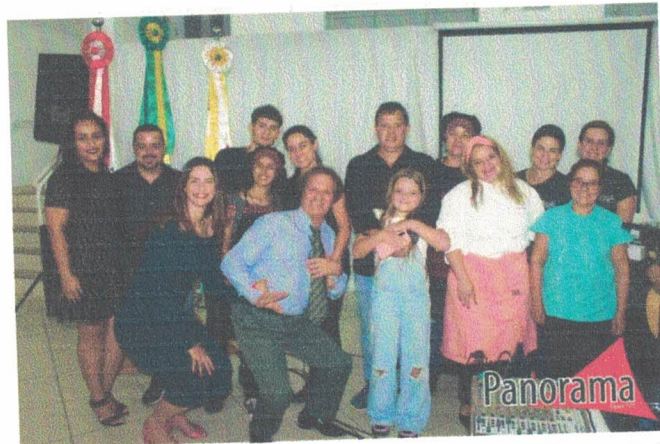
Equipe de execução do I Seminário de Patrimônio Cultural, Educação e Turismo de Bocaina de Minas. 27 de outubro de 2022.