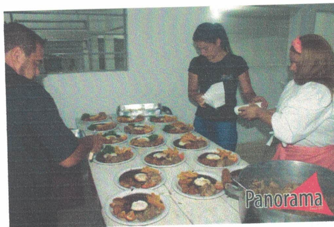
Preparo dos pratos tipicamente mineiros para degustação durante o I Seminário de Patrimônio Cultural, Educação e Turismo de Bocaina de Minas. 27 de outubro de 2022.