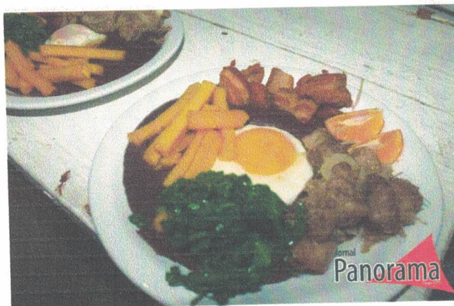
Prato principal da degustação composto de porco na lata, polenta frita, torresmo, couve refogada, ovo frito, arroz e tutu durante o I Seminário de Patrimônio Cultural, Educação e Turismo de Bocaina de Minas. 27 de outubro de 2022.