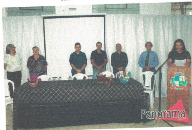
Solenidades de abertura do I Seminário de Patrimônio Cultural, Educação e Turismo de Bocaina de Minas. 27 de outubro de 2022.