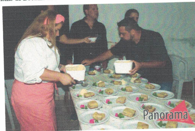
Sobremesas da degustação composto de torta de banana com ganache de chocolate e sorvete de creme durante o I Seminário de Patrimônio Cultural, Educação e Turismo de Bocaina de Minas. 27 de outubro de 2022.