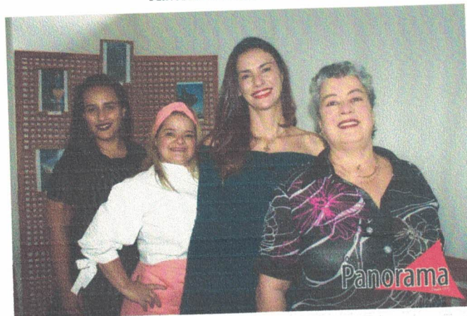
Equipe de execução do I Seminário de Patrimônio Cultural, Educação e Turismo de Bocaina de Minas. 27 de outubro de 2022.